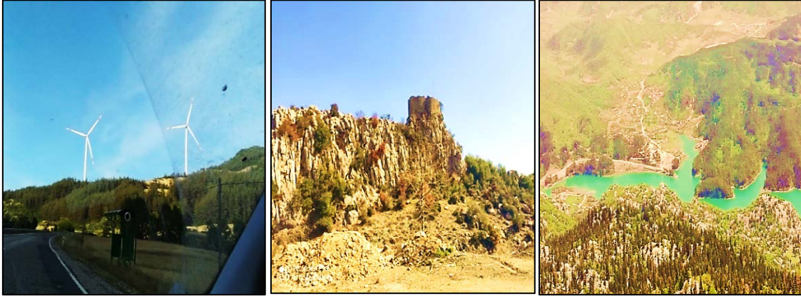
Fotoğraf 2. Rüzgâr Santrali, Haştırın Kalesi ve Aslantaş Baraj Gölü

Andırın çok eski dönemlerde Çukurova'nın doğu bölümünü İç Anadolu bölgesine bağlayan tarihî yol (Akyol) güzergâhında, Dulkadiroğullarında iki yüz yıl kalmış, 1515’de Osmanlı İmparatorluğu sınırlarına dahil edilmiştir. Kahramanmaraş merkeze yaklaşık 70 kilometre uzaklıktadır (Fotoğraf 1). 1997’de 39.713 olan nüfusu 2000 yılına gelindiğinde azalmaya başlamıştır. Yöre halkına yeterli istihdam sağlanamaması nedeniyle çevre il ve ilçelere göçler olmuştur. 2017’de 32.998’e, 2020 yılında 32.377’ye düşmüştür. Nüfus yoğunluğu ise 21 kişidir (TÜİK, 2021). Yörede kentsel fonksiyonlar belirli ölçüde gelişmiş olmakla birlikte, hala kırsal yapı ve kır ekonomisi hâkim durumdadır. Yükselti toprak şartları, eğim, bakı, bitki örtüsü, iklim, su kaynakları gibi fiziki coğrafya unsurlarının yanında nüfus, yerleşme ve ekonomik faaliyetlerin işlenişindeki değişim arazinin kullanım durumunu belirlemektedir. Bunların dışında sürdürülebilir bir arazi kullanım için beşeri coğrafya anlamında planlamaların da yapılması gerekmektedir (Karademir vd., 2020).