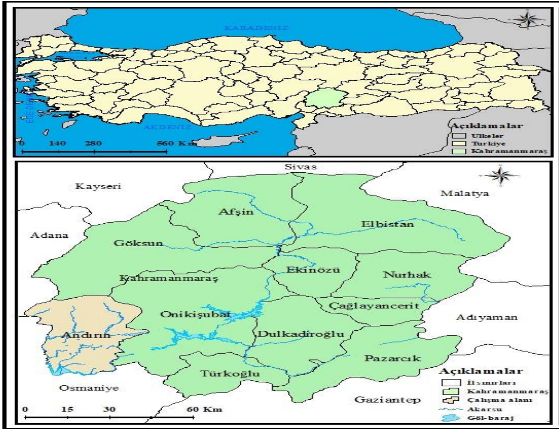
Şekil 3. Andırın Lokasyon Haritası

Andırın orman işletme müdürlüğü ve Tema vakfı tarafından Alameşe mahallesinde Defne ağaçlandırması yapılmıştır. “Har” denen defne ağacının ( Laurus nobilis ) yaprakları toplanmakta (400-500 ton) satılmakta ve sabun yapımında kullanılmaktadır. Bitkinin yaprakları iki yıl arayla Andırın belediyesi tarafından ihale edilerek toplatılmaktadır. Kozmetikten gıdaya birçok alanda kullanılabilen bitkilerden yöre halkı büyük kazanç temin etmektedir ( https://kahramanmaras.tarimorman.gov.tr ). Ayrıca yörede tadı, aroması ve büyük ekonomik getirisi olan meşe ağaçlarının köklerine trüf mantarı aşılanıp “kral yiyeceği” denen mantar türleri yetiştirilmektedir.