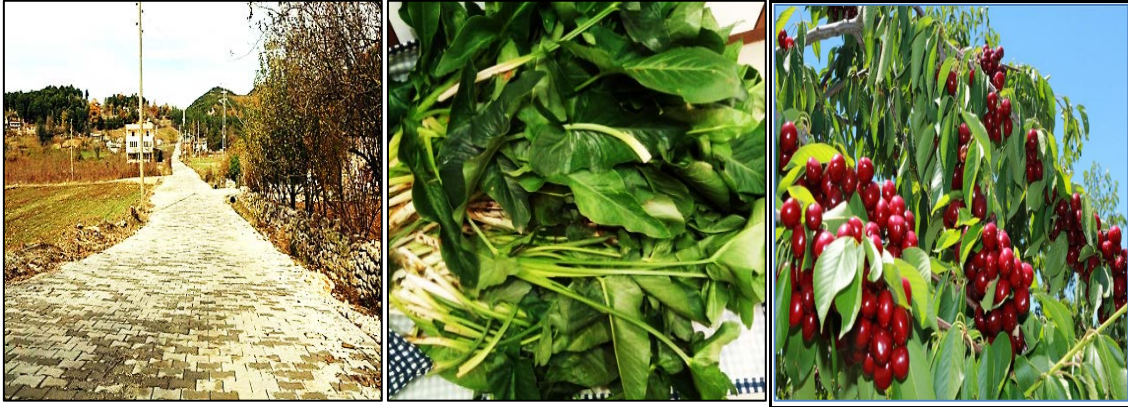
Fotoğraf 3. Akçakoyunlu Mahallesinde Kilit Parke Yapımı, Tırşik Bitkisi ve Çiğşar Kirazı

ham yol olmakla birlikte, yerleşmenin birçok cadde ve sokakları ise parke döşemeli ve asfalt yollardan oluşmaktadır. Mahallelerde yol yapım çalışmaları ve çevre düzenlemeleri devam etmektedir. İlçe terminali hem çevre mahallelere hem de il ve ilçelere durak olarak kullanılmaktadır. Restoran olarak küçük işletmeler yer almaktadır. Çok büyük alışveriş merkezleri bulunmaz. Trafik çok yoğun olmamakla birlikte özellikle yaz mevsiminde yaylalara gelen insanlar nedeniyle trafik yoğunluğu görülmektedir. GDO'lu olmayan ürünler kullanılmaktadır. Hatta sadece organik ürünlerin satışının yapıldığı küçük halk pazarları kurulmaktadır. Yerel halk ürettikleri ürünleri Çarşamba günleri Belediyenin önünde kurulan yerel pazarlarda satmaktadır. Bu satışı da daha çok kadınlar yapmaktadır.