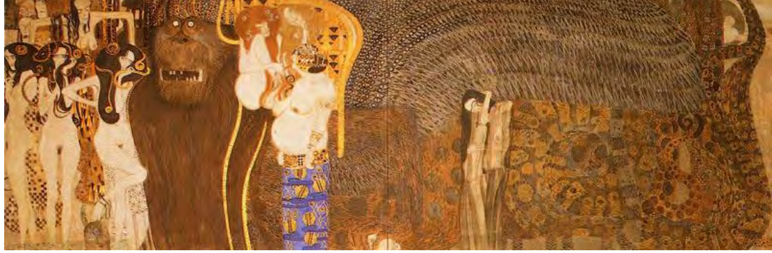
Görsel 5: Merkezi uç duvar: Düşman Kuvvetler, Avusturya galerisi Viyana (Vergo, 1973).

canlı bir şekilde gösteriliyor. Burada kullanılan üç tonun ortasındaki ana ezginin halk dansları unsurlarını benimsediği, savaşın trajik sahnesinin daha kolay ve neşeli görüldüğü söylenir (Görsel 5-5.1) (Vergo, 1973:110).