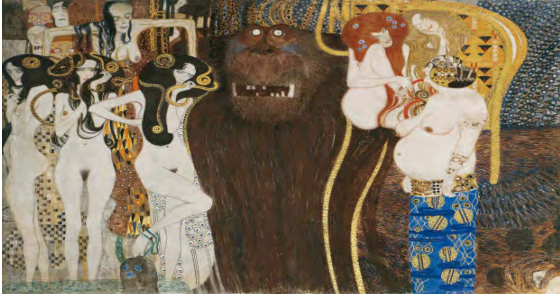
Görsel 5.1: Gustav Klimt, Beethoven Frizi, 1902 (detay), Ayrılık Binası, Viyana, Avusturya (Stanska, 2017).

Üçüncü bölüm ise Adagio, melodik şarkıdır önceki iki hareketle karşılaştırıldığında çok sessiz ve sakin görünüyor. Resimde bulunan goril bir hayvan değil mitolojik bir dev olan Typhon. Tanrıların savaşmaktan korktuğu şeytani güce sahip canavardır. Typhon'un sağındaki Yunan mitolojisi, Typhon'un yılan tüylü dişi canavarlar olarak bilinen ve erkekleri bakışlarıyla taşa çeviren üç kızını tasvir eder. Üç çıplak kadın figürü farklı duruşlarıyla öne çıkıyor. Aşırılık, şehvet ve ahlaksızlığı ifade ediyor. Aşırılık, büyük göbekli bir kadın olarak tasvir edilmiştir. Figür profilden gösterilmiştir ve vücudun üst kısmı çıplak olarak tasvir edilmiştir. Şiddetli bir savaştan sonra, savaşçılar iç gözlem aşamasına girmişler ve cennetin krallığı çoktan yaklaşmıştır. Hala gözleri kapalı yüzen melekler, cennetten şarkı söyleyen rüyalar aramak gibidir (Vergo, 1973:110). Bu anda, sanat tanrıçası Muse ortaya çıkıyor ve Beethoven Senfonisi No. 9, son doruk bölümünü başlatıyor. Muse, elindeki kitaba bakar ve melekler Ode to Joy'u söylemeleri için rehberlik etmeye başlar (Şekil 6- 6.1).