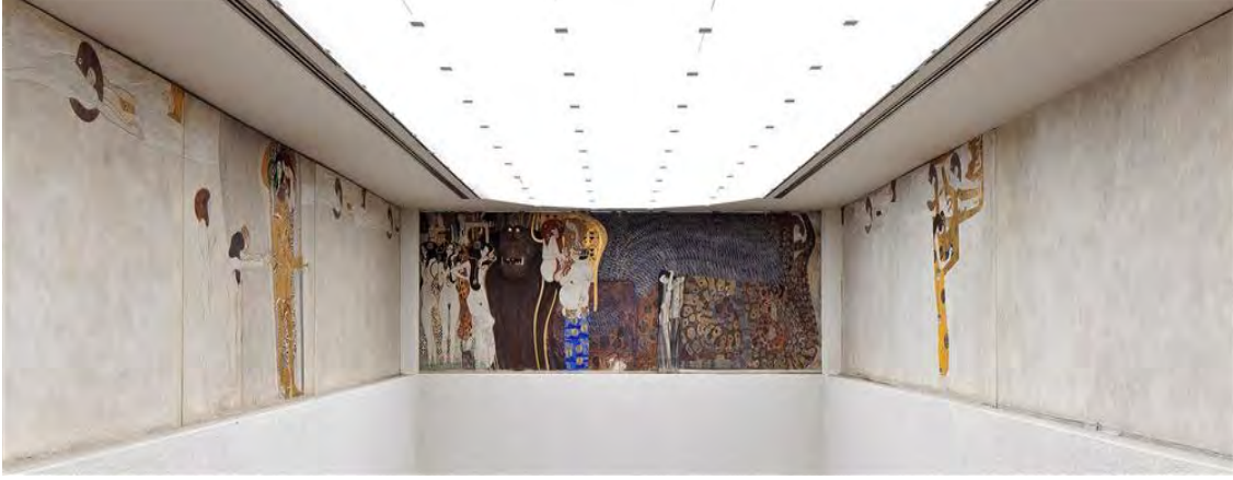
Görsel 1. Beethoven Friz bir tablosu olan Gustav Klimt sergilenen Bölünme Binası/Viyana (Pivada, 2021).

güçlü ve zayıf yönleri de müzikteki trendlerle uyumluydu. Beethoven'in duygularının senfonide güçlenen ya da zayıflayan duygularını takip edebileceğiniz gibi, aynı resim için de geçerli, açık, yumuşak ve basitten karanlığa, güçlü ve karmaşığa doğru hareket etmektedir. Beethoven Frizindeki olay örgüsü ve atmosfere göre, 9 numaralı Senfoni'nin dört hareketiyle bir dereceye kadar tutarlı olabilir (Görsel 2).