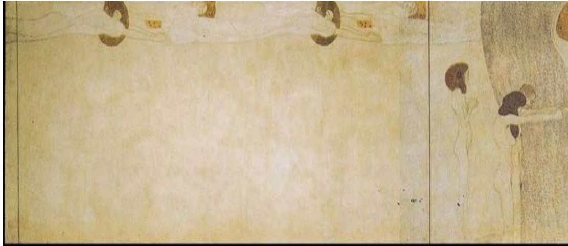
Görsel 4. Melekler (Vergo, 1973).

Resmin boş kısmının üzerinde yüzen melekler, parlak cennete ulaştıklarında durmadan peşlerine düşmeye devam ediyorlar. Gözlerini kapatanlar uyanmış gibi görünür ve bu sürekli güç aynı zamanda insanların mutluluk ve sevgi arama kararlılığının da bir sembolüdür (Görsel 4).