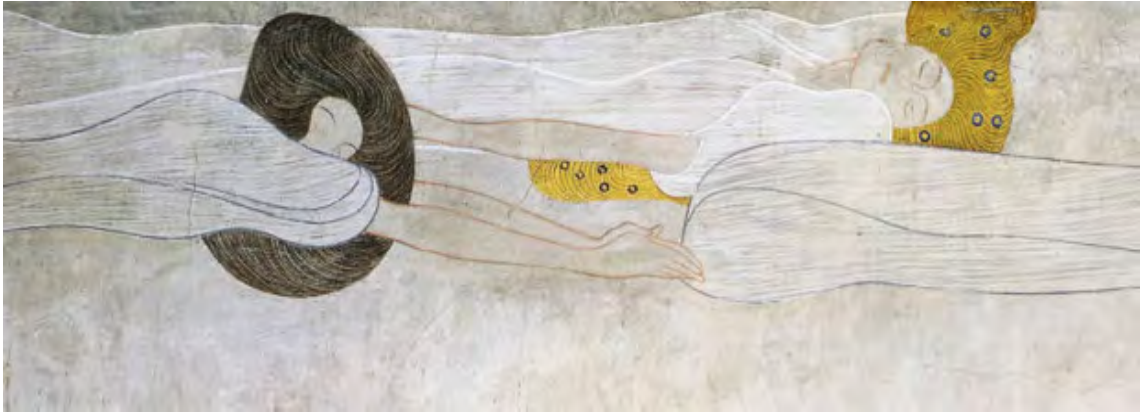
Görsel 6.1: Gustav Klimt, Beethoven Frizi, 1902 (detay): Poesie, Ayrılık Binası, Viyana, Avusturya (Stanska, 2017).

Dizi ve vokallerden oluşan dördüncü bölüm, tüm işin doruk noktasına ulaşıyor. Vokal kısmı ortaya çıkmadan önce, müzik, sanki ilk üç hareketin bir anısı ve askerlerin iniş ve çıkışlarının bir özetir ve özeti gibi, uzun bir müzik enstrümanı performansından geçmiştir. Woodward, yağmurdan sonra kara buluta nüfuz eden ilk güneş gibi yavaşça "Mutluluk arzusu şiir ve sevgide doyumu bulur" temasını ortaya çıkarır (Vergo, 1973:110). Şarkının vokal kısmı Alman şair Schiller'in aynı zamanda Beethoven'in sevilen şiiri olan Ode to Joy şiiridir, şiiri son hareketin sonu olarak kullanmıştır, Klimt'in Beethoven Frizi de burada sona ermiştir. Parlak bir şekilde gerilmiş. Kutsal ve güzel bir cennette, samimi ve uyumlu bir atmosferde insanlar tüm anlaşmazlıkları ortadan kaldırdılar. Çiftin etrafında çiçekler var. Üzerinde ay ve güneş figürleri var. Arkadan boyanmış çıplak ve kaslı erkek figürü kadın tarafından sıkıca kavranmıştır. Erkeğin öptüğü kadın figürü tam olarak görülememiştir. İyi silahlanmış güçlü şövalye, iç ve dış baskıların motivasyonu ile tüm kötülöklere karşı savaşmıştır (Fırıncı ve Zencirci 2006:137). Bu son sahnede sanat ve şiirin desteğiyle mutlu sona ulaşılmış ve bu tüm dünyaya bir öpücükle bildirilmiştir (Görsel 7). Böylelikle, friz psikolojik insan özlemini, nihayetinde bireysel ve toplumsal arayış ve sanatın güzelliği ile sevgi ve arkadaşlıkla birleşerek tatmin olduğunu açıklar (Stanska, 2017).