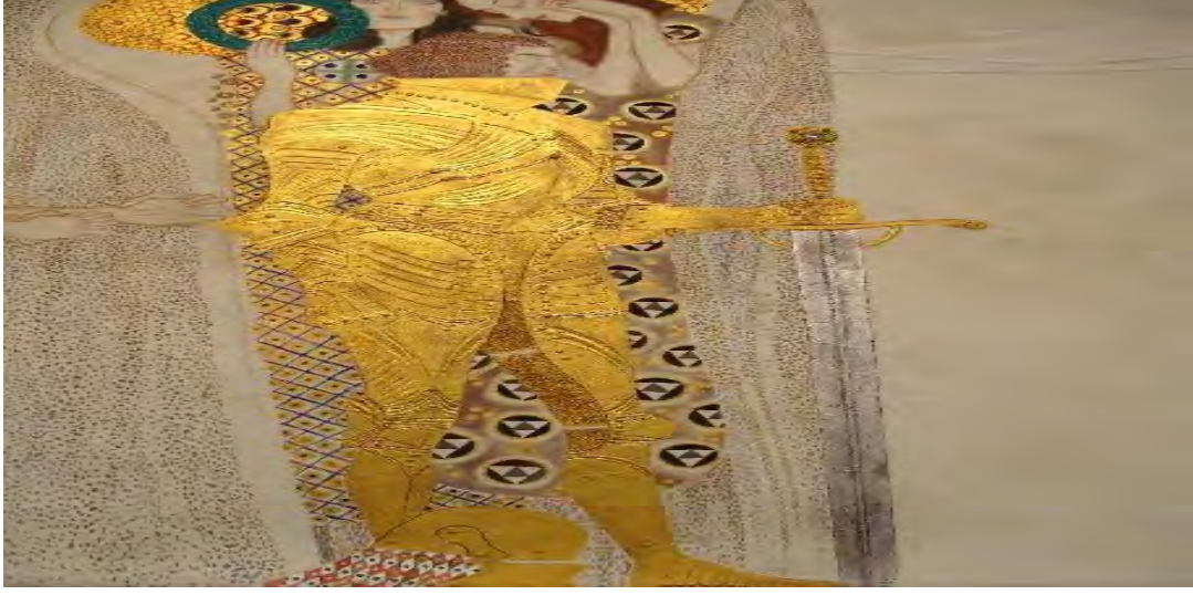
Görsel 3. Knight, Athena ve Avatar (Vergo, 1973).

Altın zırhlı kahraman, ağırbaşlı ve kararlı bir görünümle bir kılıca yaslanmıştır. O, güçlü, iyi donanımlı yabancı, arkasındaki bilgelik tanrıçası Athena ve sevgi ve güzellik tanrısı Avatar, insanların vedalaşması ve kutsamalarındaki karşı önlemleri tartışmak için bir araya gelmiştir (Görsel 3).