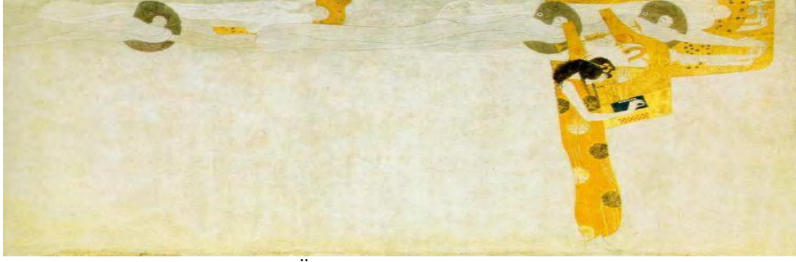
Görsel 6: Sağ Yan Duvar: Mutluluk Özlemi Şiirde Doyum Bulur.