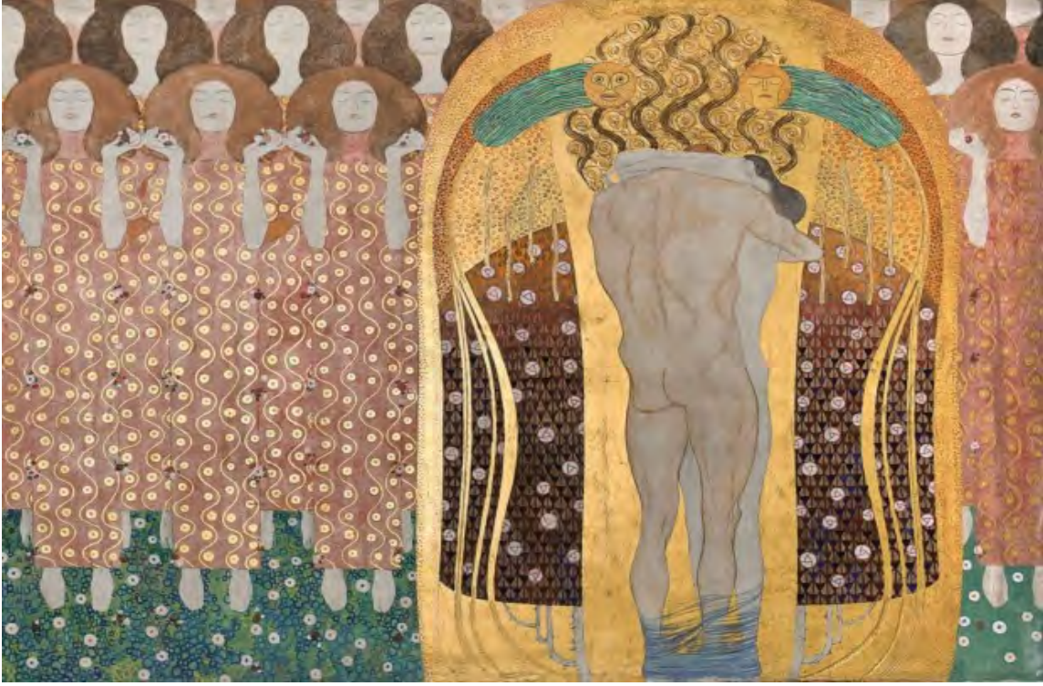
Görsel 7: Gustav Klimt, Beethoven Frizi, 1902 (detay), Ayrılık Binası, Viyana, Avusturya (Stanska, 2017).